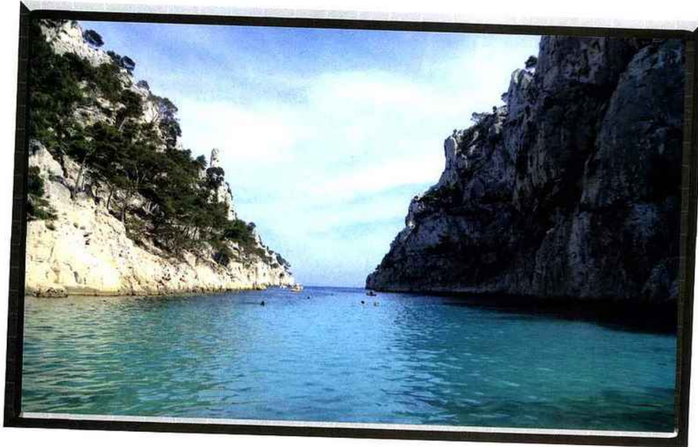
La calanque d'En Vau.