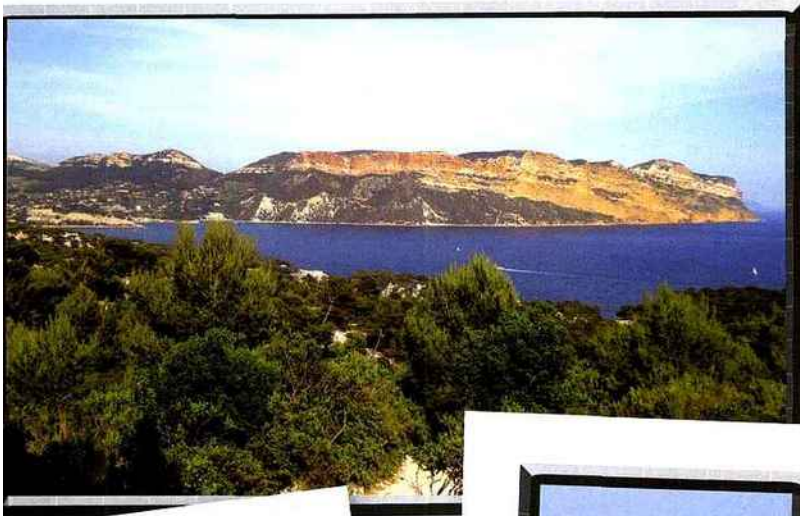
Le Cap Canaille.